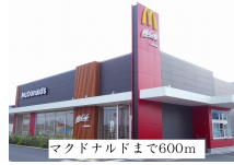
マクドナルドまで600m