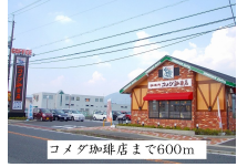
コメダジュエリーまで600m